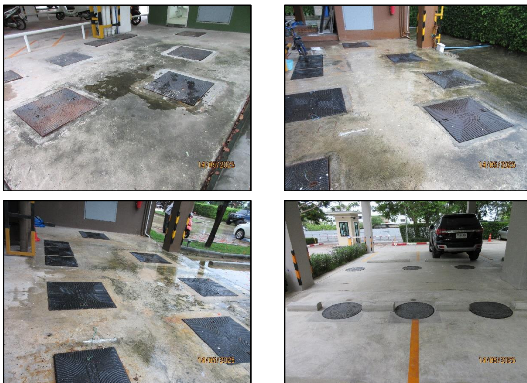
รูปที่ 1-6 ระบบบำบัดน้ำเสีย