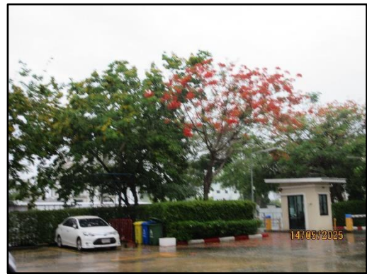
รูปที่ 1-8 พื้นที่สีเขียว (ต่อ)