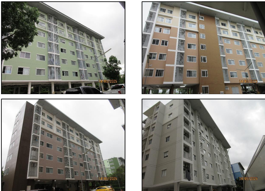
รูปที่ 1-3 ตัวอาคาร