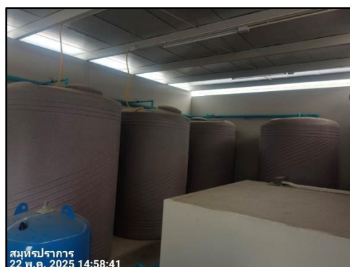
รูปที่ 1-4 ถังเก็บน้ำชั้นดาดฟ้า