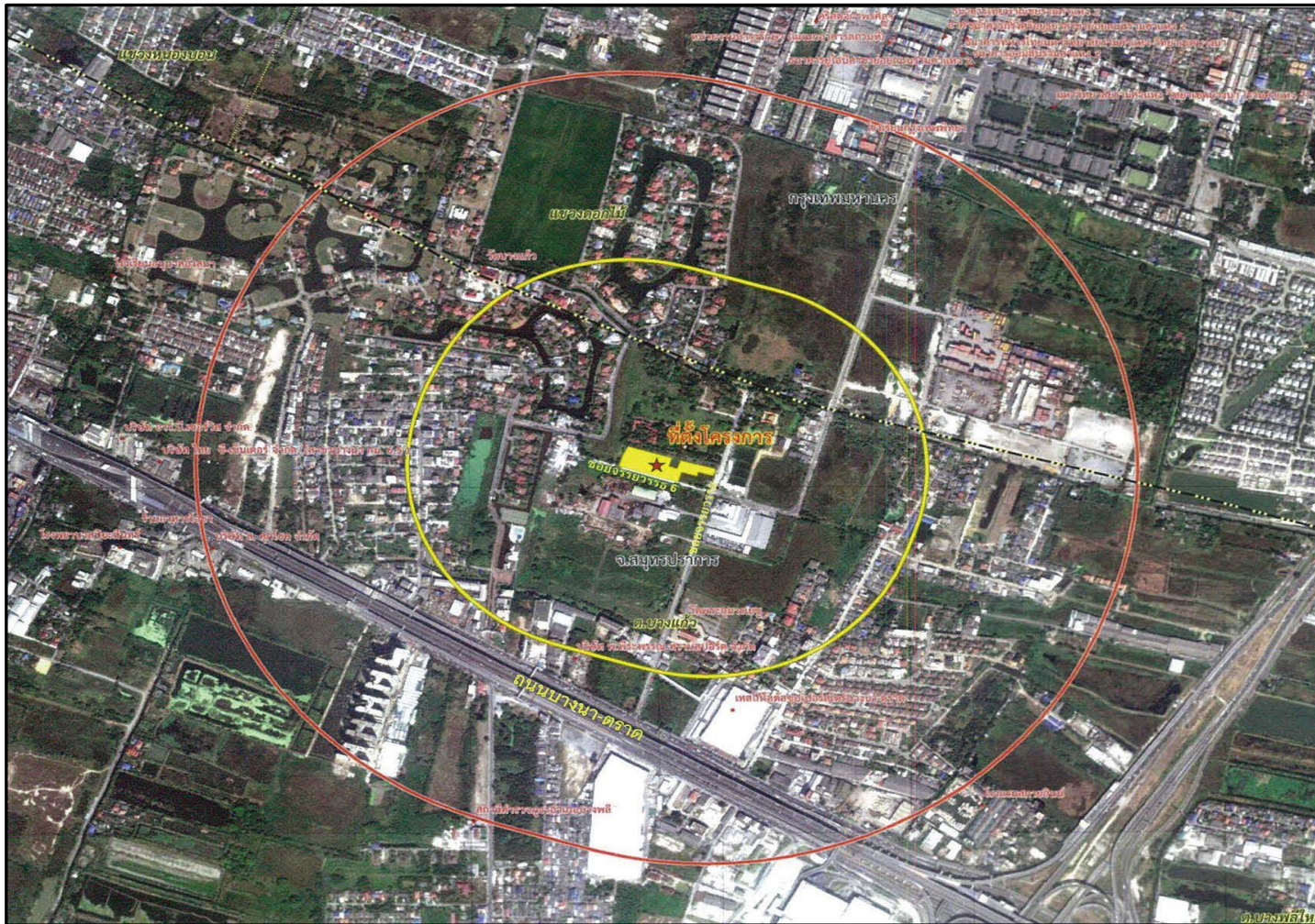
รูปที่ 1-1 ที่ตั้งและการเดินทางเข้าสู่พื้นที่โครงการ