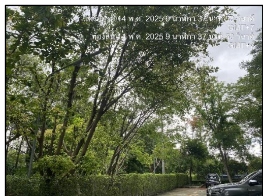
รูปที่ 1-8 พื้นที่สีเขียว