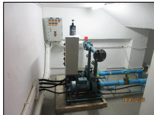
รูปที่ 1-5 ปั้มน้ำสำหรับถังเก็บน้ำชั้นใต้ดิน